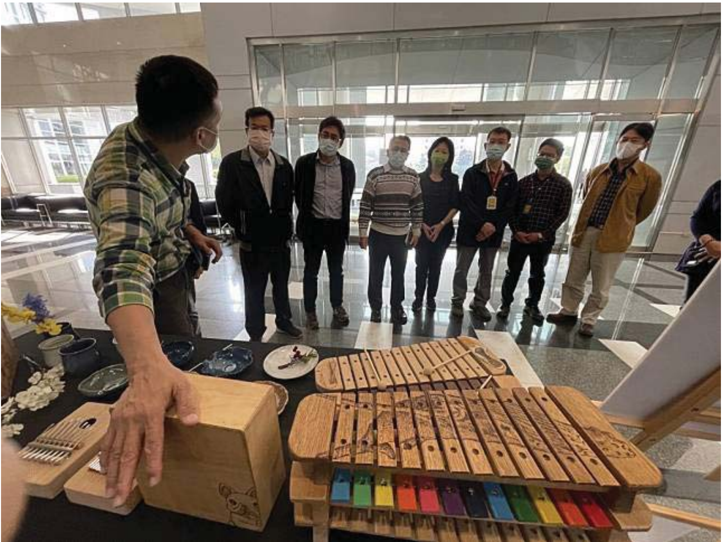
嘉藥以聲音做為敘事力載體，設計木箱鼓和木琴，透過「聲音印象」等，展現青銀共融、聲琴款款。

嘉藥表示，自一〇八年起，以獨特的「聲音地景」串連議題，以「聲音」作為敘事力載體來進行場域連結探勘與創新設計實踐的計畫，三年來號召來自高齡福祉養生管理系、社會工作系、資訊管理系、嬰幼兒保育系等九名教師，組成跨領域的青銀共融團隊，推動新創計畫課程等一系列活動。