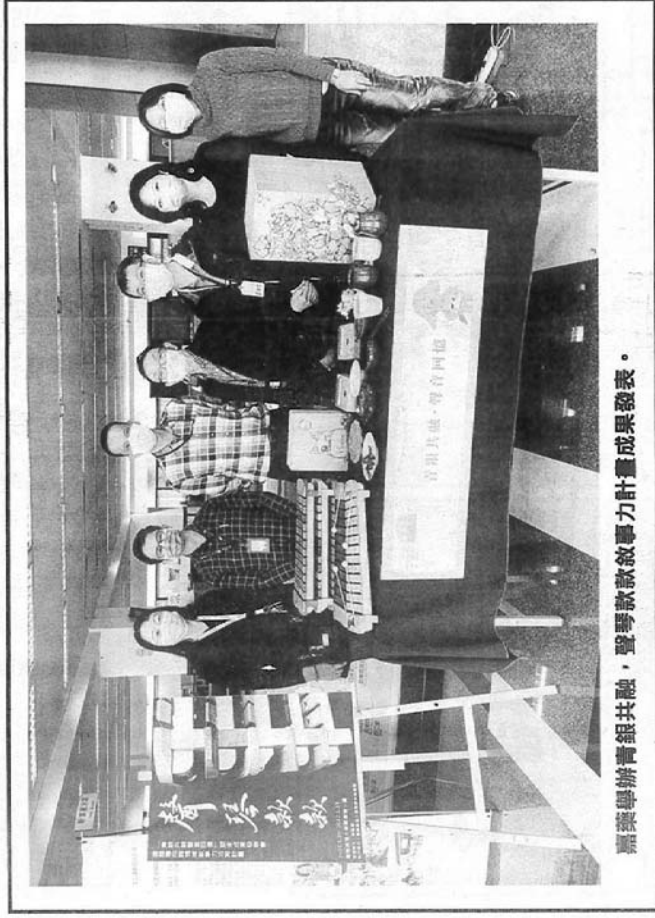
嘉藥舉辦青銀共融·聲琴款款敘事力計畫成果發表會。

現場展出了符合庶民生活的木箱鼓、能敲擊出各式音階的陶鑒樂器，還有第三年計畫主題的木琴樂器，這些成果都是由學生及社區長輩親手製作，今年的計畫以社區建立具有個人特色的社區樂團，並將邀請專業師資指導，透過社區長輩與學生一同製作樂器及音樂演奏會導入青銀共融議題，學生與社區居民在親切互動中建立社區特色和深度認同，也讓社區長者能透過團隊計畫的規劃活動，變得更健康更有活力，達成健康促進的目的，另類減緩高齡化及少子化的現象。 由湖內區太爺公館社區樂團與嘉藥同學擔綱演出的「青銀共融聲音回憶發表會」將於今日(五)早上9點到12點在高雄市湖內區中正路一段98巷號的湖內區太爺公館社區聯合活動中心登場，歡迎大家熱情參與及指教。