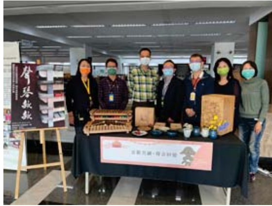
嘉藥舉辦青銀共融，聲琴款款敘事力計畫成果發表。

【記者孫宜秋／南市報導】嘉南藥理大學「青銀共融聲音記憶」敘事力計畫今（7）日於嘉藥圖書館舉辦為期五天的成果發表會，不僅記錄了過去三年與高雄市湖內區太爺公館社區長者投入的樂器製作成果，也為14日上午9點於湖內公館社區聯合活動中心登場的「青銀共融聲音回憶發表會」暖身開跑，希望能吸引更多有興趣的民眾到場觀賞湖內社區長者樂團與嘉藥同學精彩的卡林巴琴演奏。