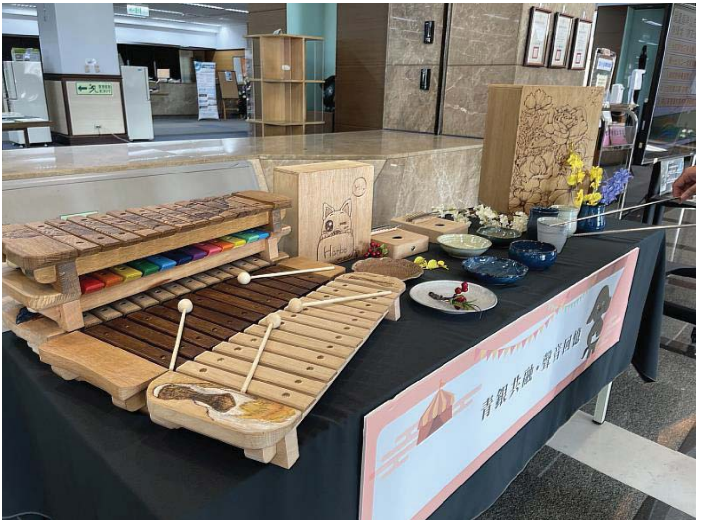
連續三年的敘事力計畫製作出木箱鼓、陶瓷樂器及木琴三種不同樂器

(中央社訊息服務20220111 11:21:47)嘉南藥理大學「青銀共融聲音記憶」敘事力計畫10日於嘉藥圖書館舉辦為期五天的成果發表會，不僅記錄了過去三年與高雄市湖內區太爺公館社區長者投入的樂器製作成果，也為14日上午9點於湖內公館社區聯合活動中心登場的「青銀共融聲音回憶發表會」暖身開跑，希望能吸引更多有興趣的民眾到場觀賞湖內社區長者樂團與嘉藥同學精彩的卡林巴琴演奏。