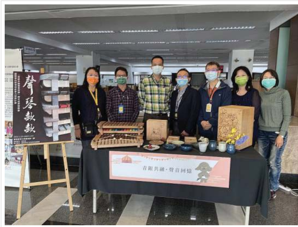
▲嘉藥舉辦青銀共融 聲琴款款敘事力計畫成果發表

(中央社訊息服務20220111 11:21:47)嘉南藥理大學「青銀共融聲音記憶」敘事力計畫10日於嘉藥圖書館舉辦為期五天的成果發表會，不僅記錄了過去三年與高雄市湖內區太爺公館社區長者投入的樂器製作成果，也為14日上午9點於湖內公館社區聯合活動中心登場的「青銀共融聲音回憶發表會」暖身開跑，希望能吸引更多有興趣的民眾到場觀賞湖內社區長者樂團與嘉藥同學精彩的卡林巴琴演奏。