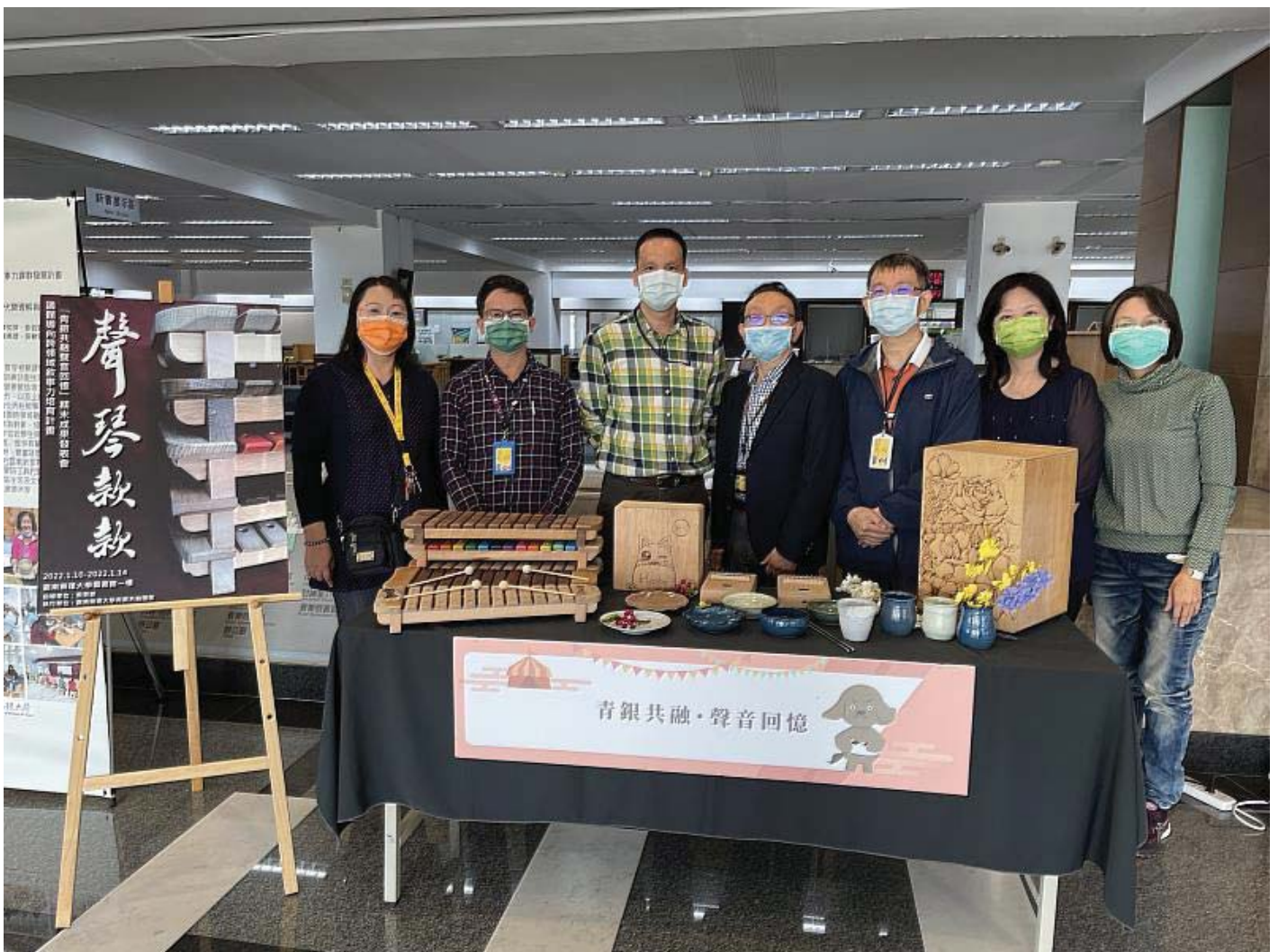
嘉藥舉辦青銀共融 聲琴款款敘事力計畫成果發表

由湖內區太爺公館社區樂團與嘉藥同學擔綱演出的「青銀共融聲音回憶發表會」將於14日(五) 早上9點到11點在高雄市湖內區中正路一段53巷1號的湖內區太爺公館社區聯合活動中心登場，歡迎大家熱情參與及指教。