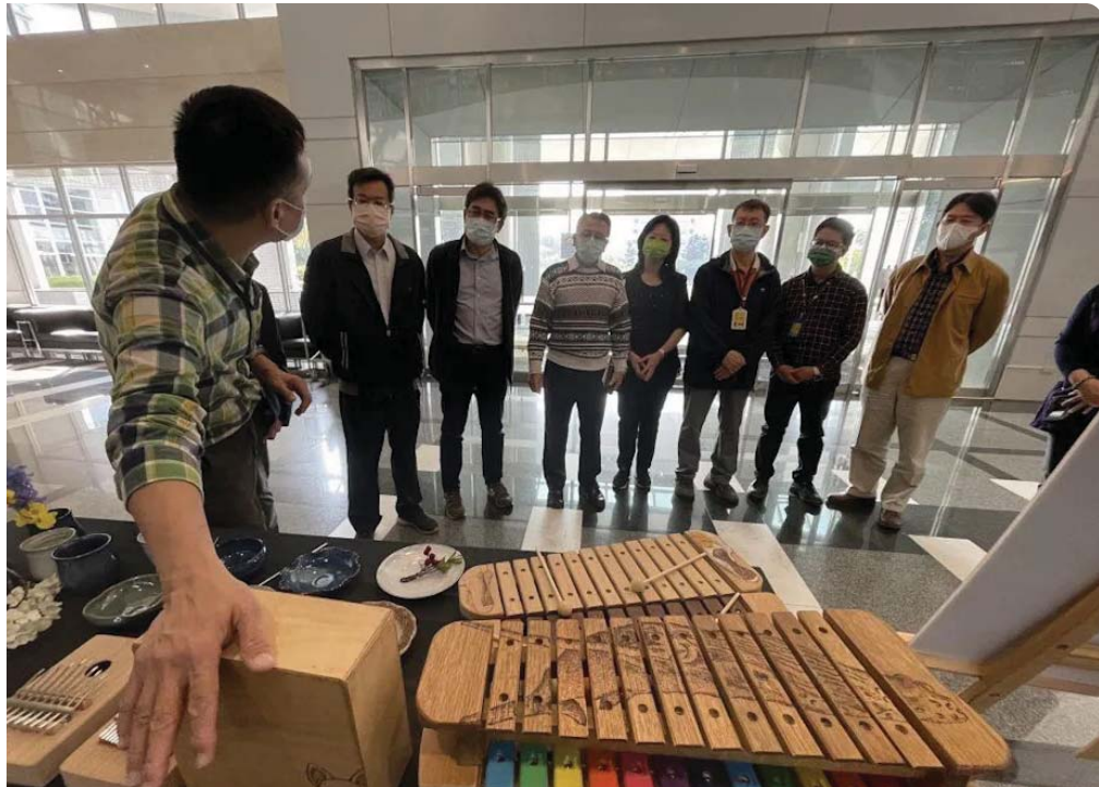
嘉藥以聲音做為敘事力載體，設計木箱鼓和木琴，透過「聲音印象」等，展現青銀共融、聲琴款款。

嘉藥表示，自一〇八年起，以獨特的「聲音地景」串連議題，以「聲音」作為敘事力載體來進行場域連結探勘與創新設計實踐的計畫，三年來號召來自高齡福祉養生管理系、社會工作系、資訊管理系、嬰幼兒保育系等九名教師，組成跨領域的青銀共融團隊，推動新創計畫課程等一系列活動。