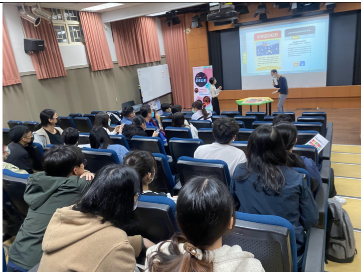
圖二、介紹桌遊玩法