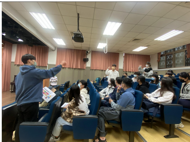
圖四、猜拳協商獲得分數