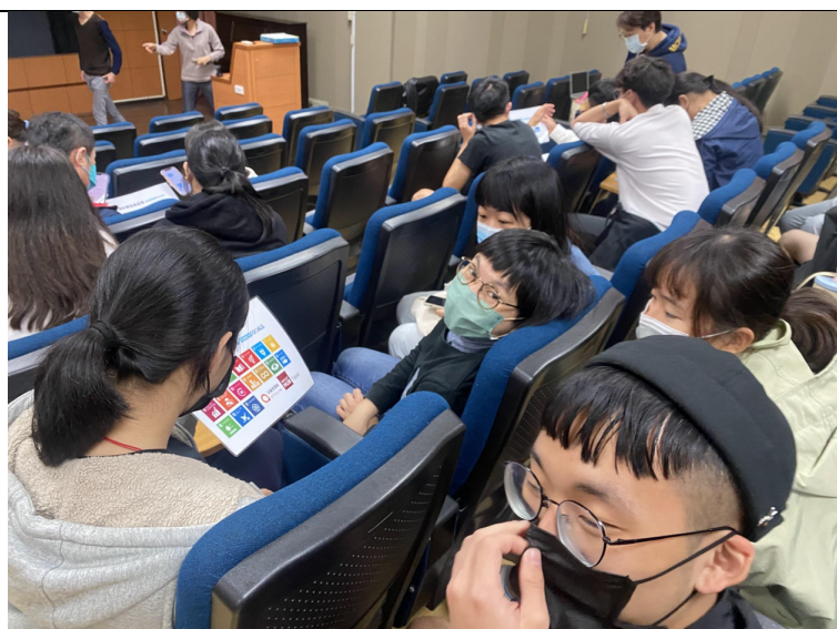
圖六、組員兼討論想下注的解決辦法