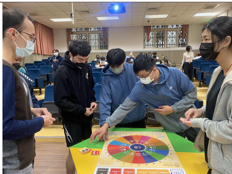
圖三、各國家代表下注解決