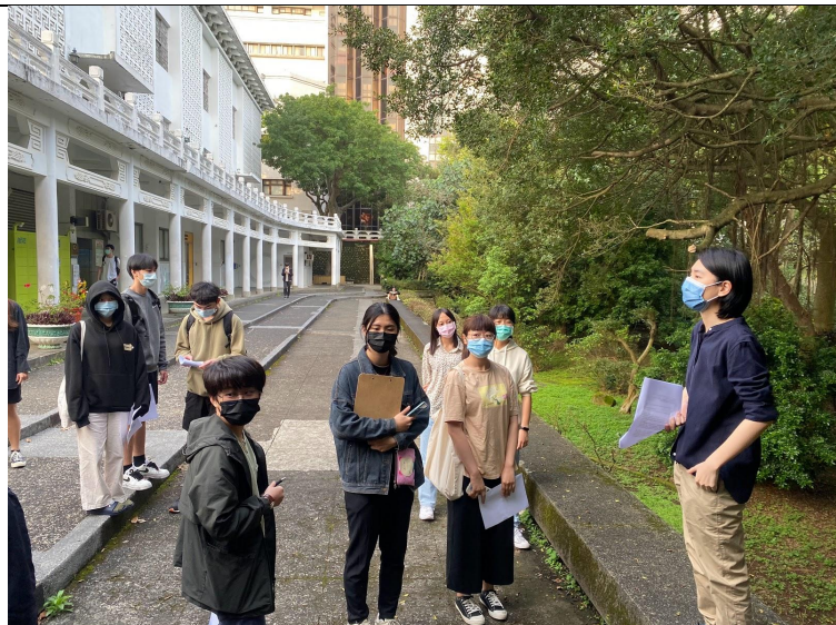
圖四、帶領同學至郵局旁的噴水池