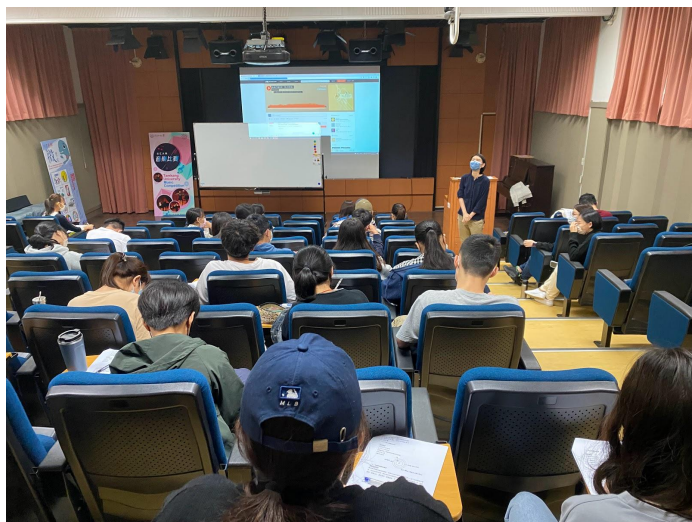
圖二、向同學介紹聲音