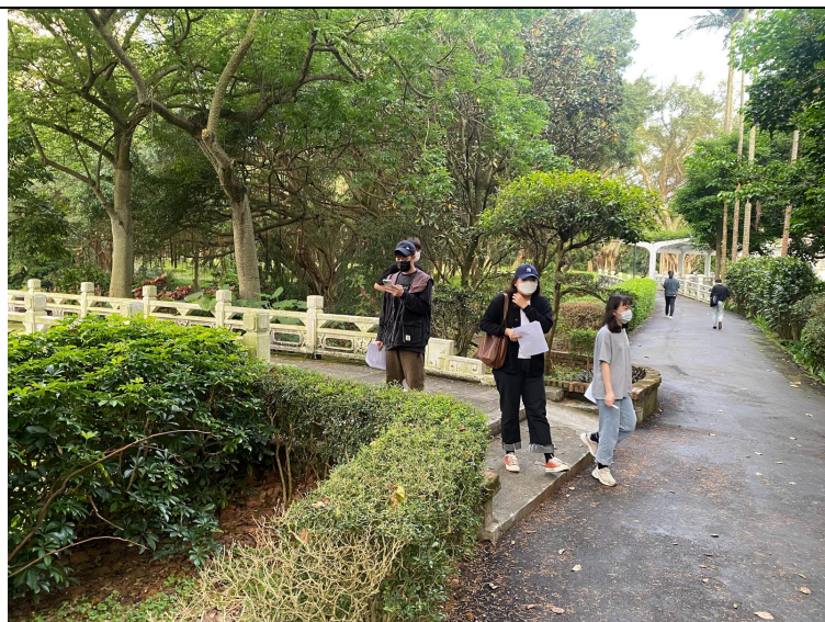
圖六、同學在校園中蒐集聲音