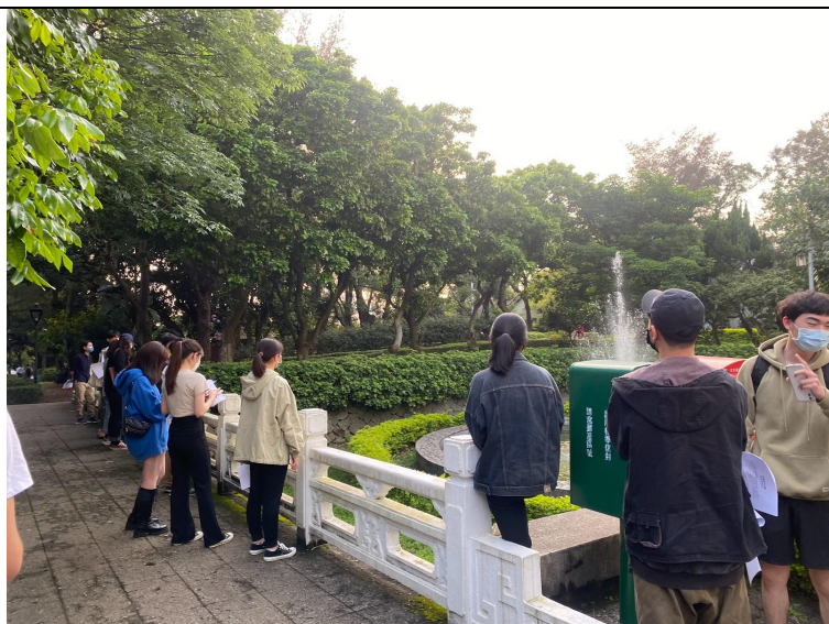
圖五、聆聽水，描寫水的聲音