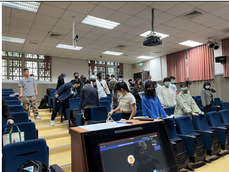
圖一、請同學活動肢體更能聆聽聲音