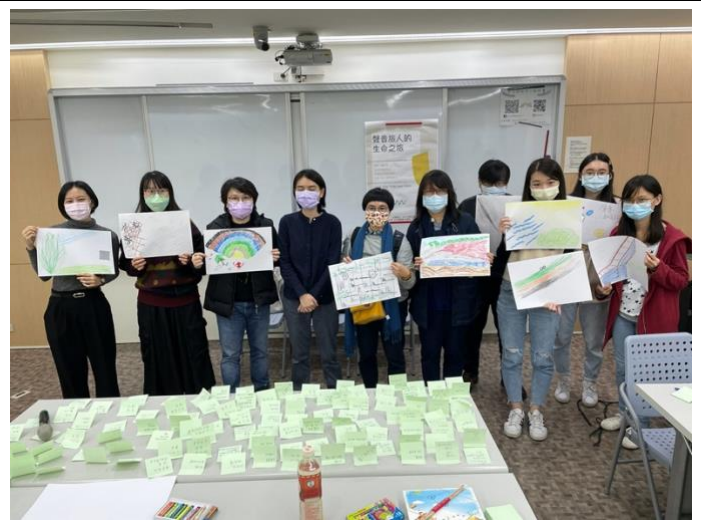
圖六、將所體驗和探索的聲音用繪畫的方式，將聲音的感受和樣子，用顏色、深淺、力度等進行表達，最後由老師引導其成員進行分享，最後以大合照做為結束