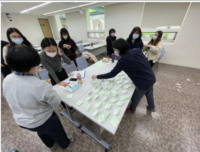
圖五、體驗活動：探索周遭環境並用便條紙記錄下聲音，回到教室將大家所收集的聲音聚集在桌上，邀請大家圍繞在桌邊，由老師引導進行成員之間的分享