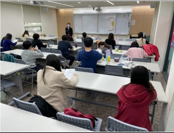
圖一、課程講師開場進入暖場