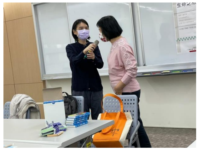
圖四、講師與成員互動，提供示範和體驗