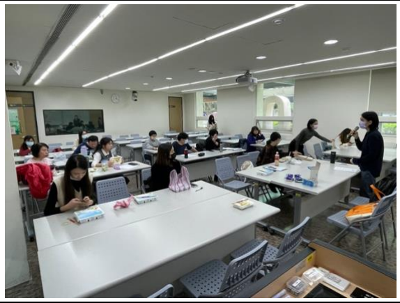
圖二、課程講師分享與引導